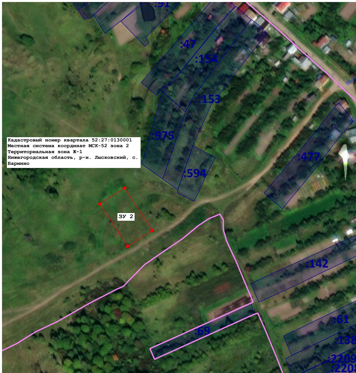
Масштаб 1:2 500